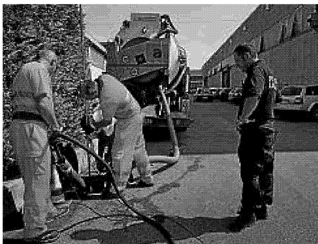
L'Arpav e Acque del Chiampo ieri al lavoro in Quinta Strada.